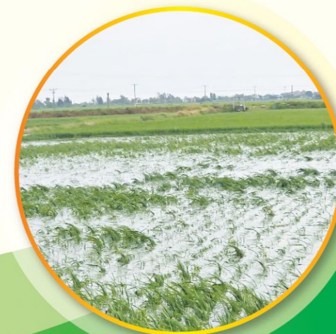
Nhiều diện tích lúa tại các tỉnh thành miền Bắc bị úng, ngập sau mưa bão, cần tập trung mọi nguồn lực bơm thoát, tiêu úng, không để ngập kéo dài, gây thiệt hại (ảnh: TK)