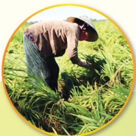
Đối với lúa bị đổ rạp cần tiến hành dựng lúa bằng cách tằm 3 - 4 gốc lúa lại với nhau bằng dây mềm thành hình chân kiềng để tạo thế đứng vững cho cây lúa (ảnh: TK)

3 VỚI DIỆN TÍCH LÚA ĐANG Ở GIAI ĐOẠN TRỞ - CHÍNH SỮA - CHÍNH SÁP: Sau khi tháo cạn nước trong ruộng nông dân tiến hành dựng lúa bằng cách tằm 3 - 4 gốc lúa lại với nhau bằng dây mềm (dây chuối/rơm nếp/nylon) thành hình chân kiềng để tạo thế đứng vững cho cây lúa vào chắc và chín.